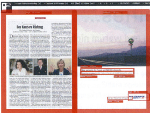
Blickverlauf einer Anzeige Millisekunden genau ausgemessen

schen für Menschen interessieren“, erläutert Schießl. „Aber man darf dabei nicht übertreiben“, ergänzt Duda, „denn es besteht immer die Gefahr, dass das kreative Key Visual die Anzeige dominiert und eine zu starke Aufmerksamkeit auf sich zieht. Darunter leidet dann der produktrelevante Teil der Anzeige.“ Aufgrund der jahrelangen Erfahrung können heute einige Standards für einen guten Key Visual definiert werden. Emotion, authentische Motive, Humor und auch Produktabbildungen springen den Leser an. Zurückhalten